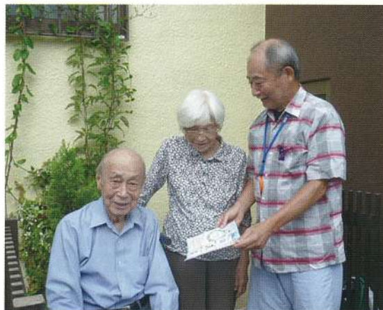
活動強化週間中の訪問