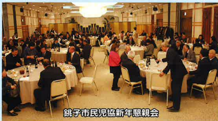
銚子市民児協新年懇親会