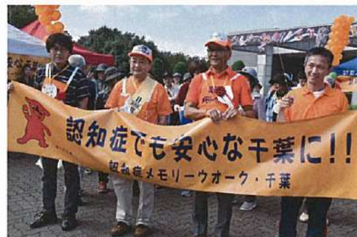
昨年のメモリーウオークの様子

歩くことは認知症の予防につながります。今年も青葉の森公園をクイズやゲームをしながら楽しく歩き、認知症についての理解を呼びかけます。