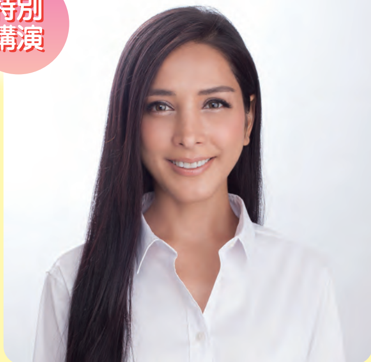
サヘル・ローズ さへる ろーず Sahel Rosa 女優・タレント・キャスター