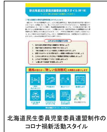
北海道民生委員児童委員連盟制作の コロナ禍新活動スタイル

さらに“対面での見守り”が難しくなったいま、電話やメール、SNSの活用や、パソコンやタブレットでのビデオ通話を使った安否確認やオンラインイベントの実施、対話アプリのチャット機能を利用した地域情報の発信、委員が直筆で手紙を書き、住民宅の様子を伺いながら郵便受けに届けるなどの活動を実践しています。