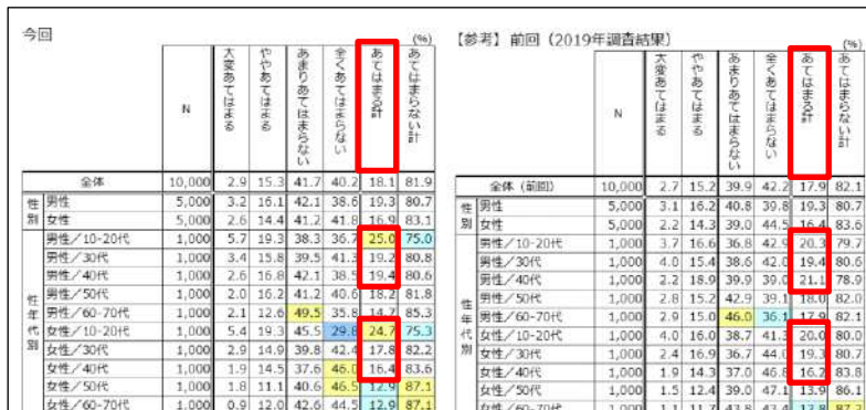
【表 1】(質問)将来的には「民生委員・児童委員」になってみたいですか？ 左が今回(2022年)、右が前回(2019年)の調査結果

調査で、「将来的には『民生委員』になってみたいか」という質問に対し、「大変あてはまる」または「ややあてはまる」と回答したのは、男女ともに 10~20 代が全体平均よりも高く、かつ全世代で最も高い約 25%(4 人に 1 人)になりました。2019 年に実施した調査と比較すると、男女ともに 4.7 ポイント増加しています。