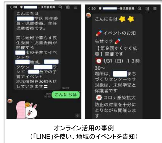
オンライン活用の事例 （「LINE」を使い、地域のイベントを告知）