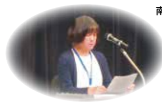
西部地区より発表