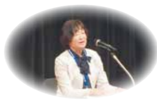
南部地区より発表

これから地域とともに 令和5年10月6日にさらにホールにて民生委員児童委員合同研修会を開催しました。137名の民生委員児童委員がさらにホールに集まり、身近な相談相手として地域の方々に寄り添えるよう、福祉サービスや児童相談に関する知識を深めることができました。私たちは継続的な学びを大切に、その学びを地域に還元することで地域貢献を目指したいと考えています。 令和2年より猛威をふるっていた新型コロナウイルス感染症の影響により、人と会わない時間が増え、地域住民同士の繋がりが希薄化しつつありました。令和5年5月に2類から5類へ移行したことに伴い、少しずつ訪問活動を再開し、直接お顔を合わせるようになってきた。このような日々の活動の中で、新たに地域住民同士の繋がりを構築し、孤立しない、させないよう、私たち民生委員児童委員は訪問活動や見守り活動に努めてまいります。