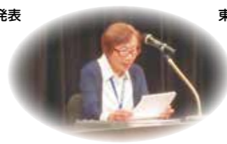
中央地区より発表