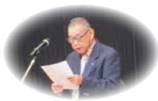
中央東地区より発表