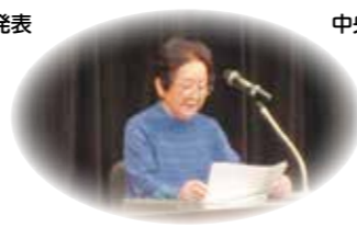
北部地区より発表