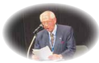
東部地区より発表