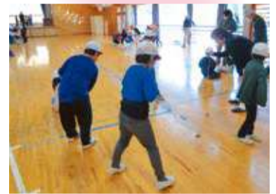
授業に協力 (こままわし)