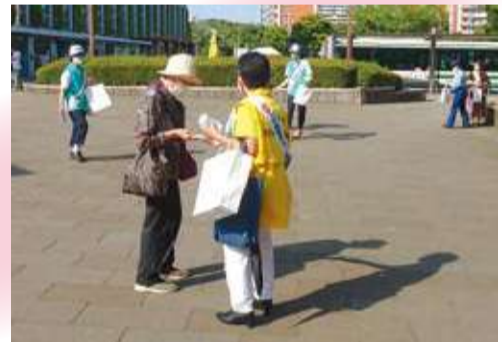
社会を明るくする運動街頭キャンペーン参加