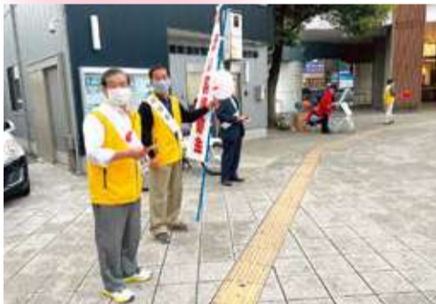
赤い羽根共同募金活動／浦安駅