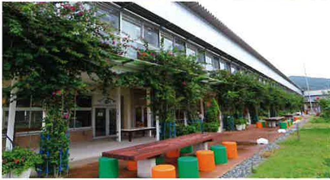
道の駅保田小学校