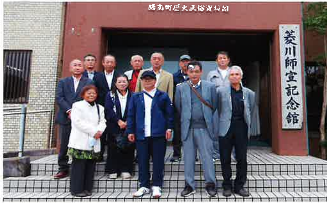
野栄町歴史民俗資料館

② できる範囲での食料配布と困っていること等の聞き取り。 ③ 毎日役場を訪問しての情報収集と住民への伝達。(停電復旧見込み、ガソリンスタンド稼働情報、避難所開設情報等その他様々) 大変なご苦労の様子伝わってききましたが、私たちもその様な災害時の対応として、関係機関(主に役所や社会福祉協議会)との情報共有と連携、民児協内の連携等が重要であると考