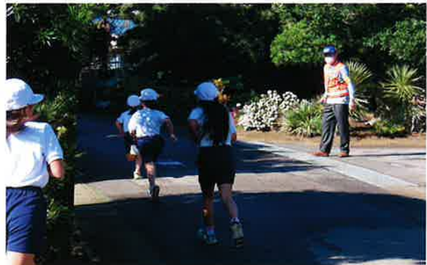
マラソン大会での安全確保の活動