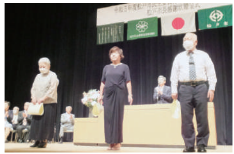
表彰を受けた3名の委員の皆様