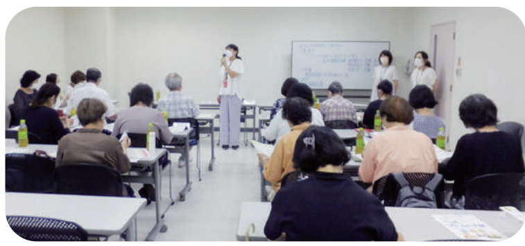
保健師の方からフレイル予防の基本を学んでいます