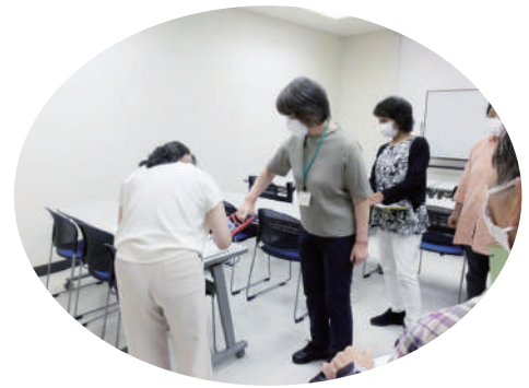
ただいま握力測定中・・・