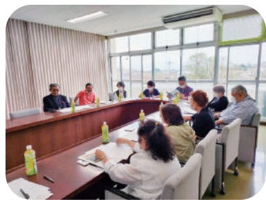
他地区民児協との交流を深めました