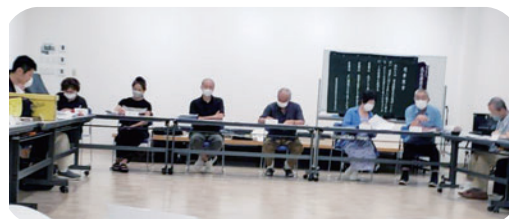
地区定例会で委員同士の連携を図っています

四季を通じて行事を計画し、地域の輪を広げ「人とひととの繋がりが深まる」ように努力しています。