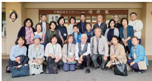
高齢者部会の皆さん