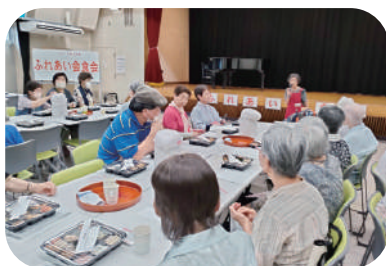
常盤平市民センターでのなごやかな「ふれあい会食会」