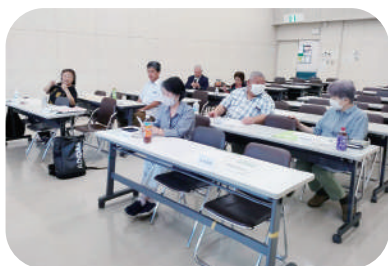
地区定例会では、毎月活発な議論がおこなわれています