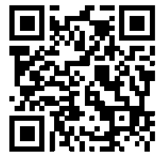
申込みフォーム QR コード

※申込み開始日などは「学長室 社会福祉研修センター」ホームページをご参照ください。