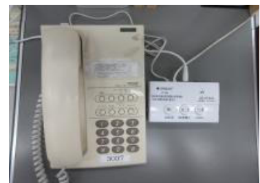
【電話機に取付けたイメージ】